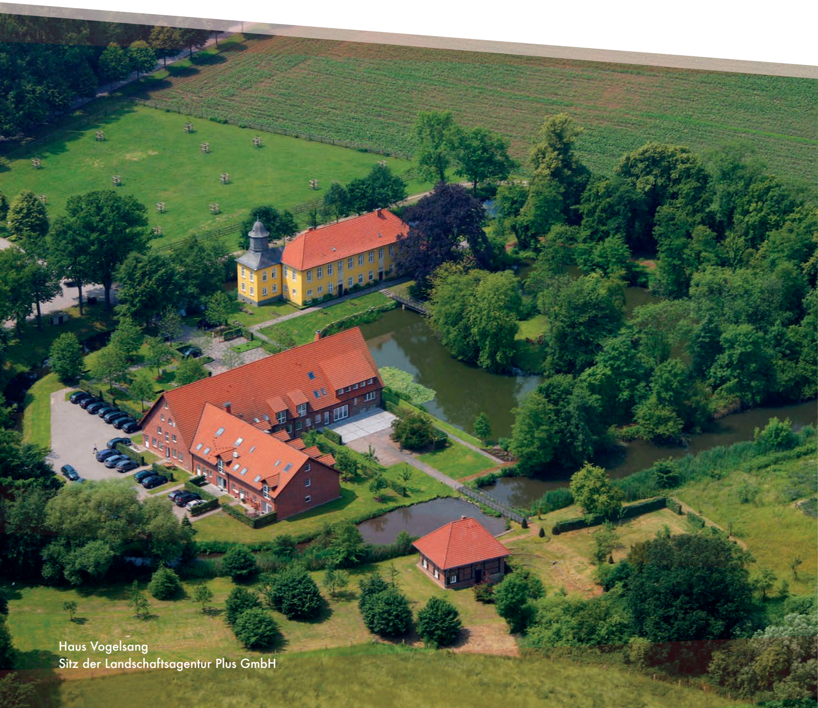
Haus Vogelsang Sitz der Landschaftsagentur Plus GmbH